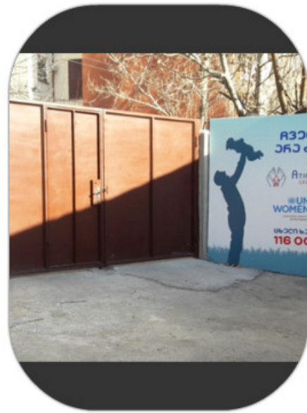
ადამიანი ვაქრობის (ტრეფიკინგის) მსხვერპლთა, დაზარალებულთა დაცვისა და დახმარების სახელმწიფო ფონდი